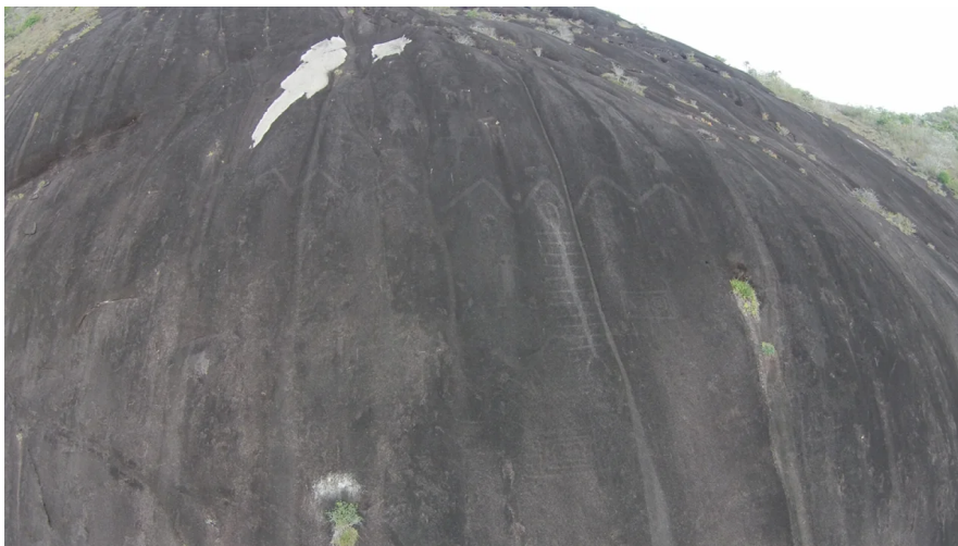
Cerro Pintado en Venezuela.

Sin embargo, el motivo más representado son las serpientes gigantes , y una en particular, en un sitio llamado Cerro Pintado en Venezuela, de aproximadamente 42 metros (138 pies) de largo, es probablemente el grabado rupestre más grande registrado en cualquier parte del mundo, sugirieron los investigadores.